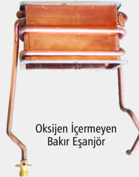
Oksijen içermeyen Bakır Eşanjör