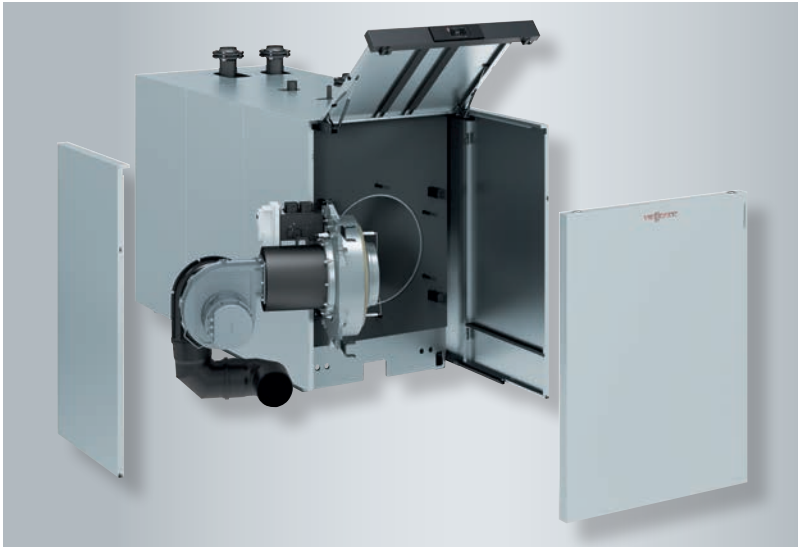
Çıkartılabilir yan ve ön kapaklar sayesinde servis ve bakım kolaylığı

Vitocrossal 200, çıkartılabilir yan ve ön kapakları ile tüm komponentlere kolay ve hızlı bir şekilde ulaşılma imkanı sunar. Bu sayede yüksek servis ve bakım konforu elde edilir.