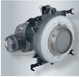
Kompakt MatriX-disk brülör

Vitotronic kontrol paneli - geniş renkli dokunmatik ekran ile sezgisel kullanım