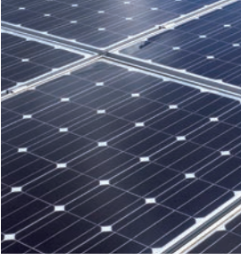
Vitovolt 300 monokristal fotovoltaik modül

Güneşten gelen elektrik: Türkiye’de kişi başına düşen ortalama elektrik tüketimi miktarı az sayıda modül ile karşılanabilmektedir.